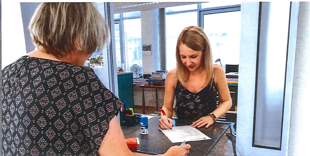
Auch Dokumente der Einwohnerdienste werden vermehrt gefälscht. Ein Sicherheitspapier soll dies verhindern.

Die heute vorhandenen technischen Möglichkeiten und Geräte erlauben es Laien, amtliche Dokumente mit wenig Aufwand zu verändern oder zu fälschen. Die Einwohnerdienste der Schweiz wappnen sich mit einem Sicherheitspapier.