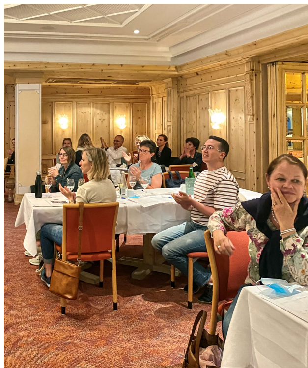
Impressioni dal seminario di St. Moritz 2021