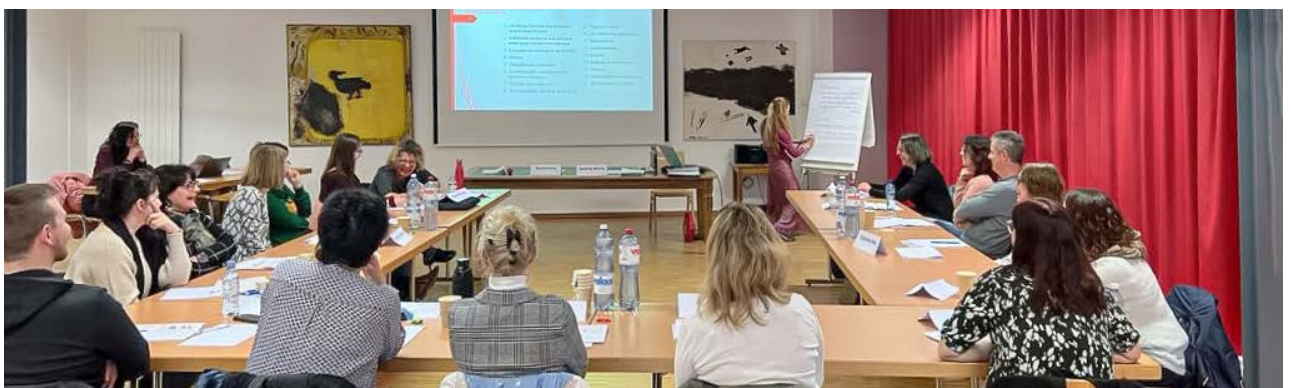
Formazione continua nella Svizzera francese