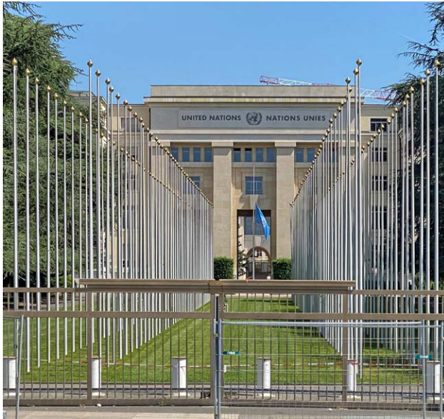
Visita alla sede dell'ONU a Ginevra