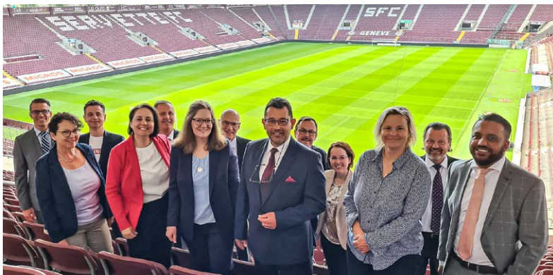
Il Comitato allo stadio dell'FC Servette